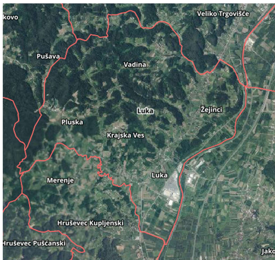
Slika 2. Administrativno područje Općine Luka – naselja: Luka, Krajska Ves, Žejinci, Pluska, Vadina