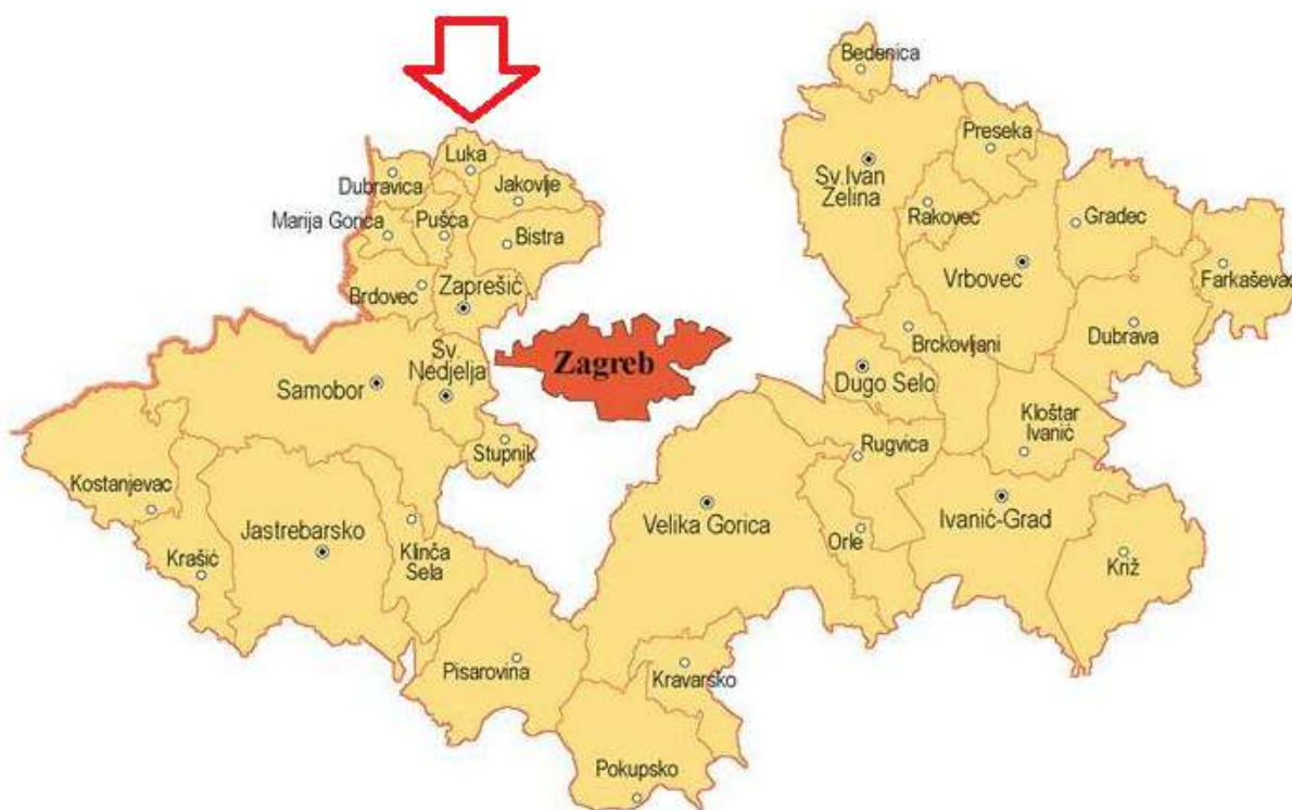
Slika 1. Položaj Općine Luka u Zagrebačkoj županiji

Iako je površinom jedna od manjih općina, njezina strateška pozicija uz važne prometne pravce predstavlja ključni dio lokalnog identiteta te otvara vrata za daljnji razvoj gospodarske, komunalne i turističke infrastrukture, pretvarajući Luku u privlačno mjesto za moderni ruralni turizam i stanovanje.