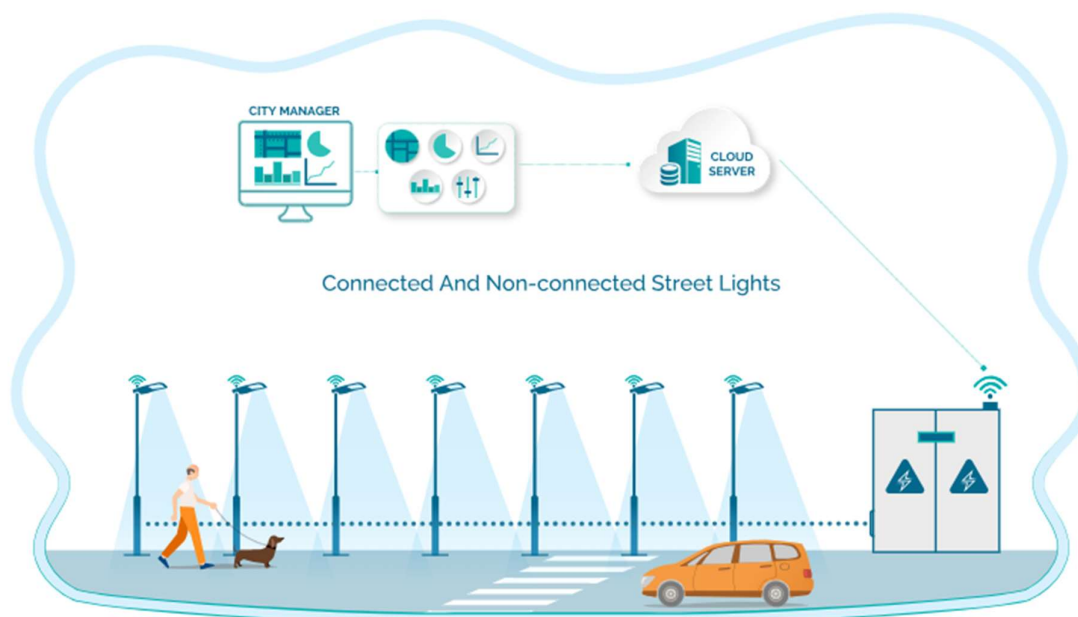
Slika 3. Slikoviti prikaz kompletnog sustava javne rasvjete