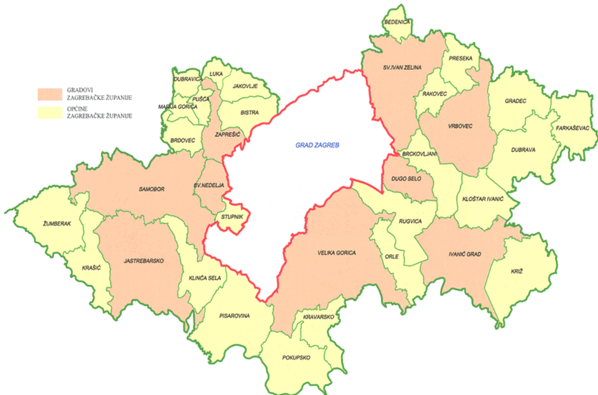
Slika 1: Kartografski prikaz Zagrebačke županije