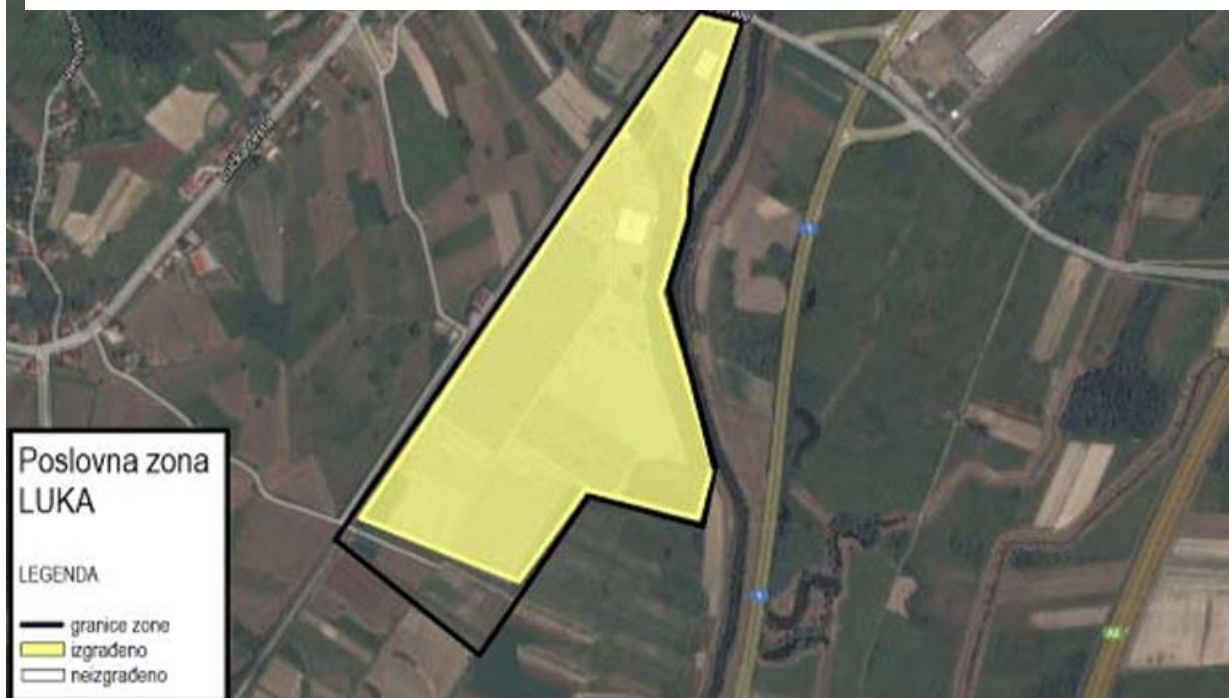
Slika 2 Gospodarska zona Općine Luka

infrastrukturuom - električnom energijom, vodovodnim i plinskim instalacijama, odvodnjom, telekomunikacijama, izgrađenim prometnicama, javnom rasvjetom. Za investiranje je trenutno ostalo raspoloživo 14 hektara. Trenutno su u zoni smještene tvrtke Lagermax Autotransport d.o.o., Lagermax Logistics d.o.o. i VM2 d.o.o.